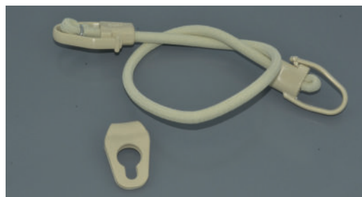
Sandow V avec plaquette (selon forme de la bâche)